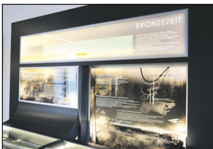
Tempus - Museum für Archäologie Almeggerstr. 5, Bad Wimsbach/N.