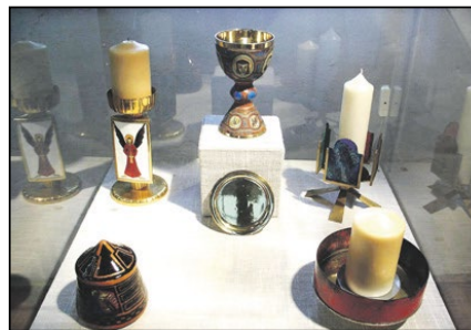
Emailmuseum Vorchdorf Schlossplatz 7, Vorchdorf