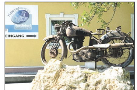
Motorradmuseum Amering Peintal 27, Vorchdorf