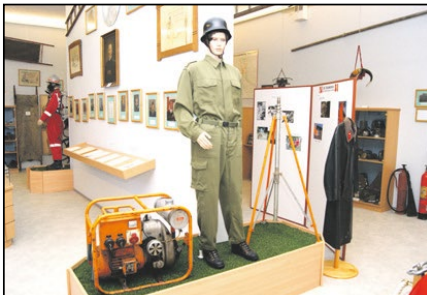
Feuerwehrmuseum Dr.-Mitterbauerstr. 4b, Vorchdorf