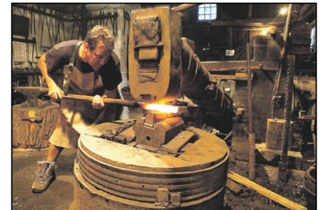
Freilichtmuseum Hackenschmiede Almeggerstr. 12, Bad Wimsbach/N.