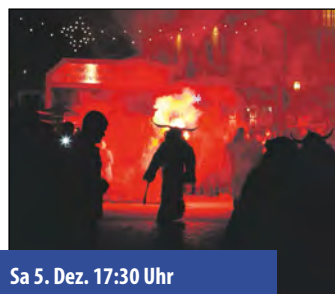
Sa 5. Dez. 17:30 Uhr