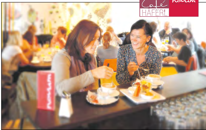
Ein Novum: das neue Wohnzimmer von Ried

„Drei Lokale, ein Genuss“, lautet die Genussformel im Alpenvorland neuerdings. Denn das Novum in Vorchdorf hat nach dem Café Häferl eine weitere Schwester bekommen: das Novum in Ried im Traunkreis. Auch dort hat sich das Café mit Bar und Lounge bereits als Wohnzimmer für alle - mit Bedienung - etabliert. Kein Wunder, besticht das Rieder Novum im RGZ direkt an der Kremsmünsterer Bundesstraße doch mit denselben Qualitäten wie seine Vorchdorfer Geschwister.