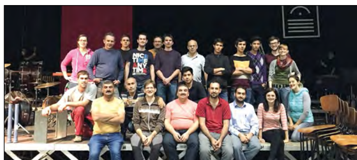
Bemühungen zur Integration von Flüchtlingen in Vorchdorf sind in den Vereinen spürbar. Jüngstes Beispiel ist die tatkräftige Mithilfe beim Aufbau zum Herbstkonzert der Marktmusik.

In Vorchdorf leben rund 20 Asylwerber - Gruppe „Daheim in Vorchdorf“ um Integration bemüht