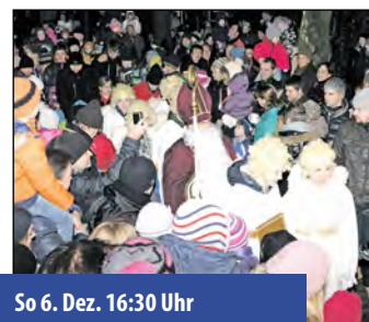
So 6. Dez. 16:30 Uhr

Über 45 Aussteller, lebendiges Handwerk und Kunsthandwerksausstellung