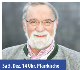
Sa 5. Dez. 14 Uhr, Pfarrkirche