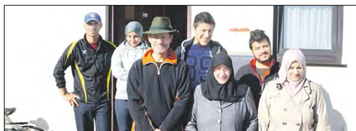
Die beiden Familien im Flüchtlingshaus Bad Wimsbach-Neydharting