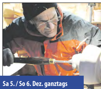
Sa 5. / So 6. Dez. ganztags

Die Mondsee Schlossteufel sorgen für schaurige Stimmung.