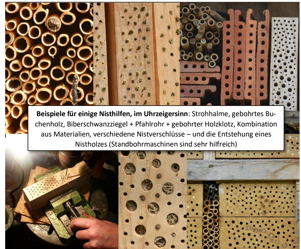
Beispiele für einige Nisthilfen, im Uhrzeigersinn: Strohhalme, gebohrtes Buchenholz, Biberschwanzziegel + Pfahlrohr + gebohrter Holzklötz, Kombination aus Materialien, verschiedene Nistverschlüsse – und die Entstehung eines Nistholzes (Standbohrmaschinen sind sehr hilfreich)

Der Standort einer Nisthilfe sollte immer sonnig, warm, windgeschützt und trocken sein. Selbst kleinste Objekte werden besiedelt, kein Ort ist ungeeignet!